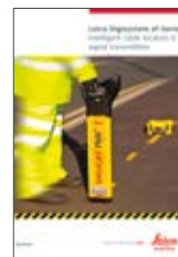
Leica Digicat xf Broszura