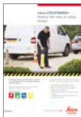
Leica UTILIFINDER+ Ulotka

Ilustracje, opisy i dane techniczne nie są wiążące. Wszystkie prawa zastrzeżone. Drukowano w Polsce – Copyright Leica Geosystems AG, Heerbrugg, Szwajcaria, 2015. 843932pl – 12.15 – INT