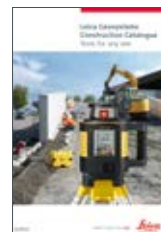
Narzędzia dla budownictwa Katalog

Leica Geosystems Sp. z o.o. ul. Przasnyska 6b, 01-756 Warszawa Tel.: +48 22 350 59 00 Fax: +48 22 350 59 01