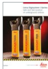
Leica Digicat, seria "i" Broszura